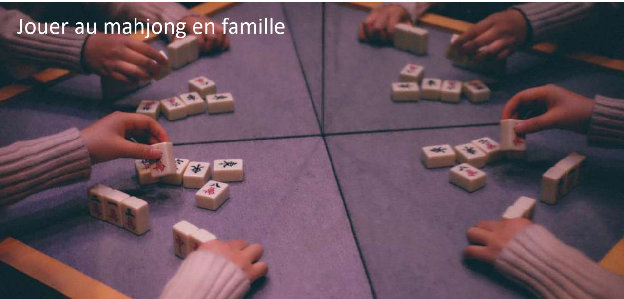
Jouer au mahjong en famille